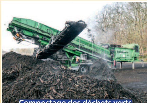
Compostage des déchets verts

30 000 tonnes de déchets recyclés par an