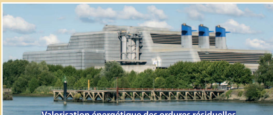
Valorisation énergétique des ordures résiduelles